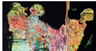
Maciej Durski, Powrót, olej na płótnie, 92x171

Pod wielkim urokiem malej kropli, cz. 6 – Jadwiga Hajdo Pod wielkim urokiem malej kropli, cz. 5 – Jadwiga Hajdo Pod wielkim urokiem malej kropli, cz. 4 – Jadwiga Hajdo Pod wielkim urokiem malej kropli, cz. 3 – Jadwiga Hajdo Pod wielkim urokiem malej kropli, cz. 2 – Jadwiga Hajdo Pod wielkim urokiem malej kropli – Jadwiga Hajdo