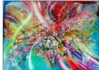
Maciej Durski, Początek, 130x95, olej, płyta, 2018

Nie stawiam sobie ograniczeń co do techniki ani materiałów – po prostu nie znajduję żadnych powodów, aby to robić. Zajmuję się raczej poszerzaniem spektrum swoich możliwości – dlatego, między innymi, odszedłem od malowania na płótnie. Ograniczało ono możliwość wykorzystania niektórych materiałów i zastosowania technik, wymagających twardego podłoża. Maluję na płytach kompozytowych, bo są lekkie, odporne mechanicznie i nie niszczą się podczas odkrywania warstwy zmalowanych warstw. Czy zaczynając malować obraz wiem, jak będzie wyglądał po skończeniu pracy? Nigdy.